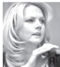
Татьяна Голикова, министр здравоохранения и социального развития России

■ «Тем, кто не в состоянии вовремя получить разрешительные документы на высокотехнологичные виды медицинской помощи, нечего и рассчитывать на дотации из федерального бюджета».